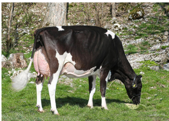
PTIT COEUR UNIX DARLINGA