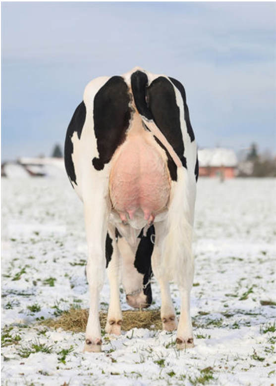
REBIN GENIE CAMBOGIA