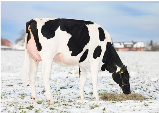
REBIN GENIE CAMBOGIA