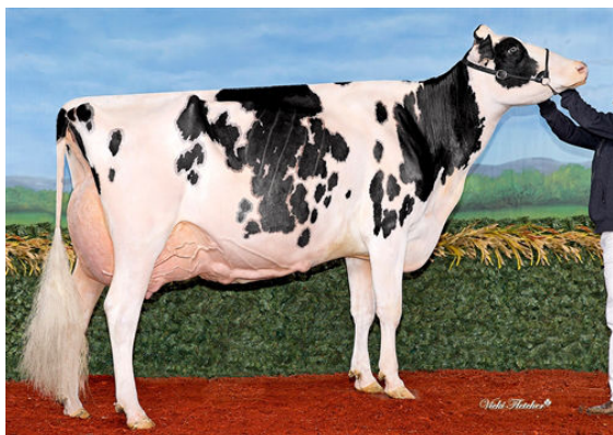
IDEE WINDBROOK LYNZI DAM