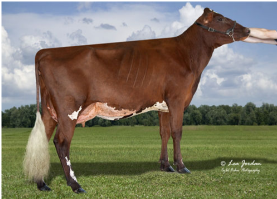
HOT MESS CONRAD BIRDIE