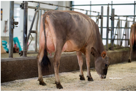
BRIDON PNV VERONICA