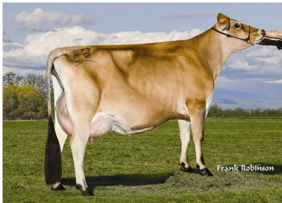
GR FARIA BROTHERS CHARNESA