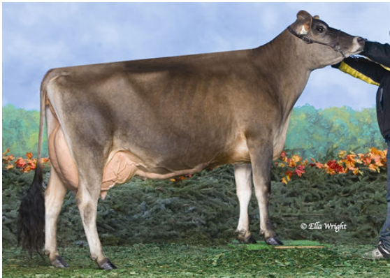
RJF BELLE'S IMAGINATION