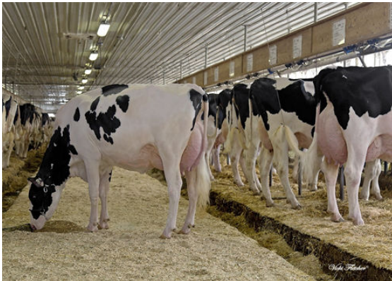
PROVETAZ ALLIGATOR WALIS GRANDDAM