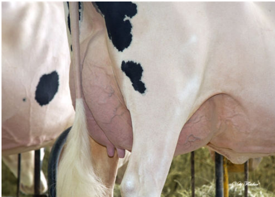
PROVETAZ ALLIGATOR WALIS GRANDDAM