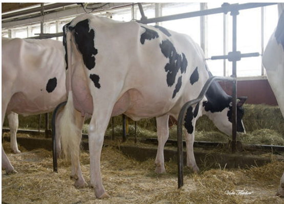
PROVETAZ ALLIGATOR WALIS GRANDDAM