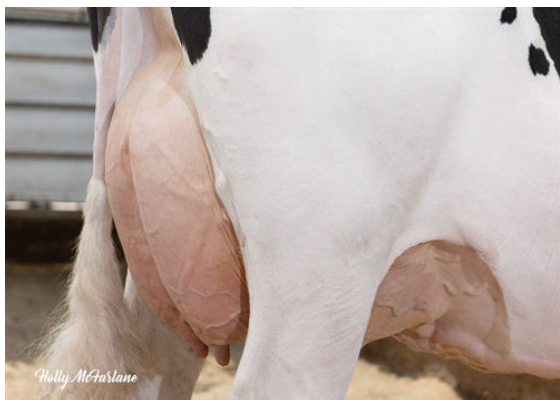
OCD LEGENDARY RAE FOURTH DAM