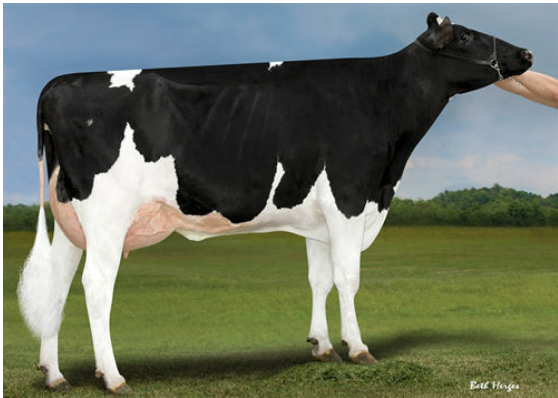
SIMPLE-DREAMS 4825 F2757 FOURTH DAM