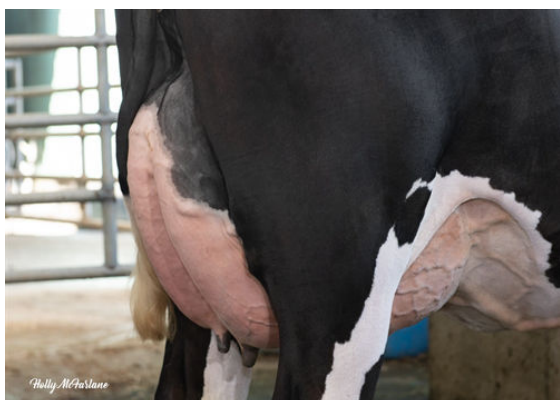
WESTCOAST FSTBL FAR8167 10707