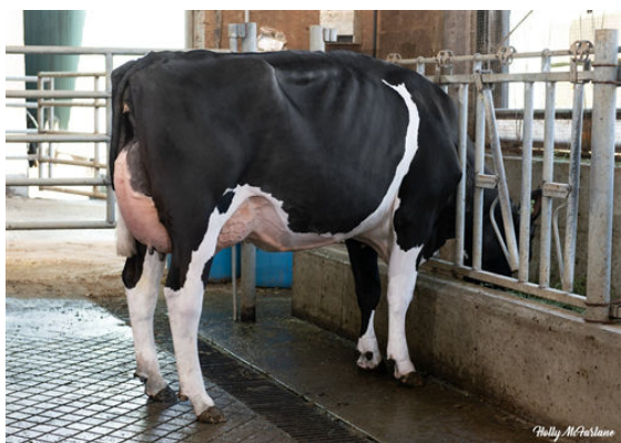
WESTCOAST FSTBL FAR8167 10707