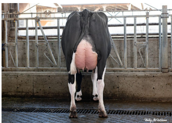
WESTCOAST FSTBL FAR8167 10707