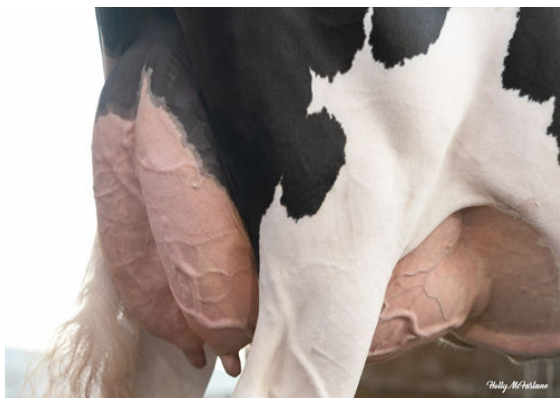
PROGENESIS YODA PALOMA GRANDDAM