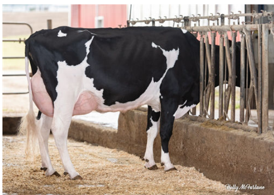
PROGENESIS TORRO JAZZHANDS