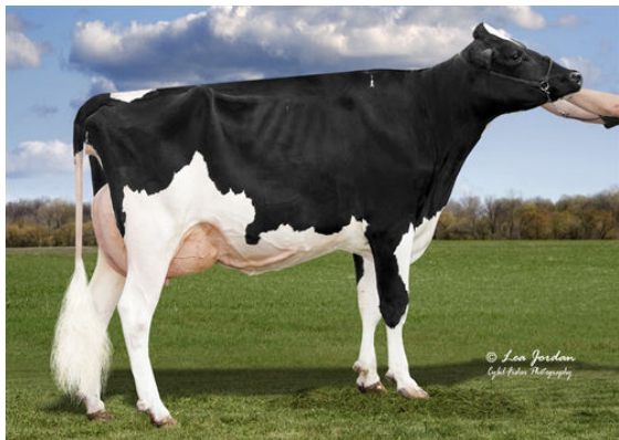
JIMTOWN KD NARCISA