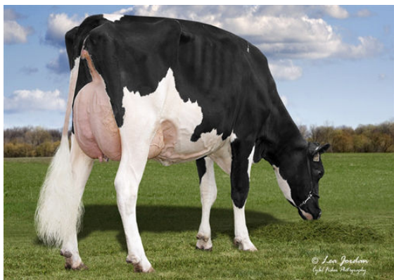
JIMTOWN KD NARCISA