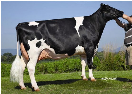
JUNIPER GOLDWYN WISTFUL FIFTH DAM