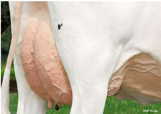
LADYS-MANOR GRNT OOHM DAM