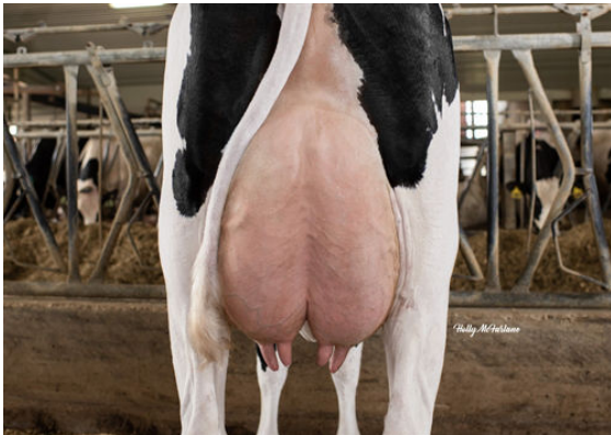
PROGENESIS TOPNOTCH GARNET