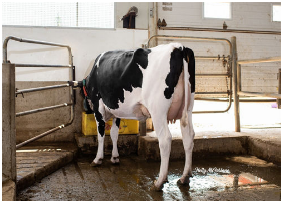
PROGENESIS TOPNOTCH GARNET