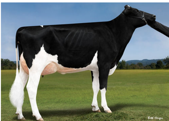
PROGENESIS MONTANA GALATEA