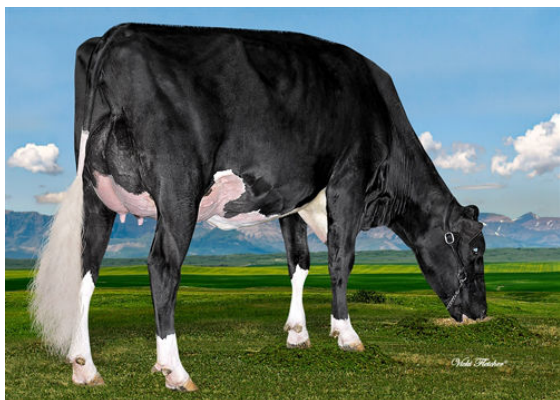
WESTCOAST MONTANA RIZA 4700