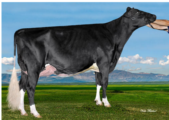
WESTCOAST MONTANA RIZA 4700