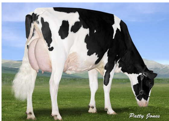
EDG RUBY UNO RIZA