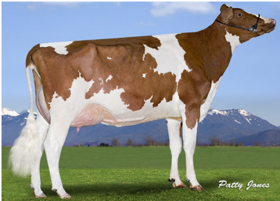
WESTCOAST ATWORK SHAE 3109 RED GRANDDAM