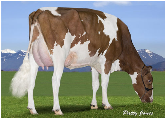
WESTCOAST ATWORK SHAE 3109 RED GRANDDAM