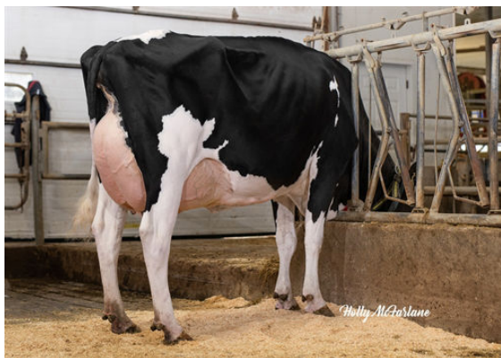
PROGENESIS SUPER BEAST DAM