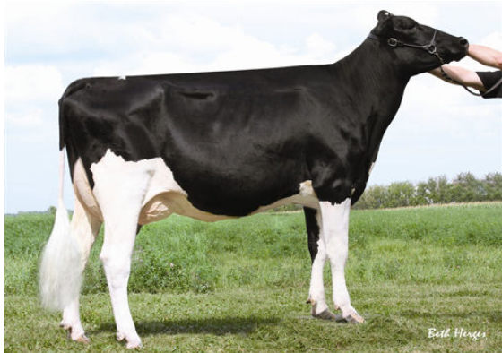
GRANDEUR GW TRILLIAN FIFTH DAM