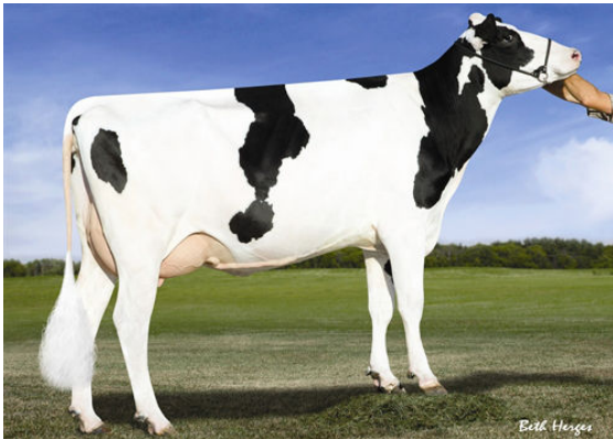
SANDY-VALLEY ROBUST RUBY THIRD DAM