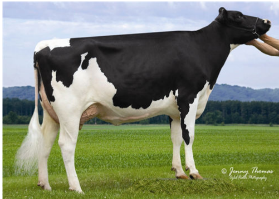
BEN-AKERS JO LUISE-9 FIFTH DAM