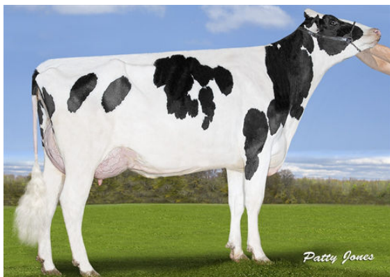
SILVERRIDGE DUKE ELSA-P