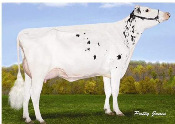
VELTHUIS SG SNOW EVENT