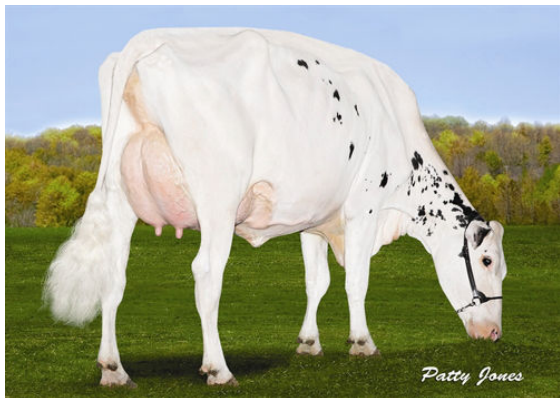
VELTHUIS SG SNOW EVENT