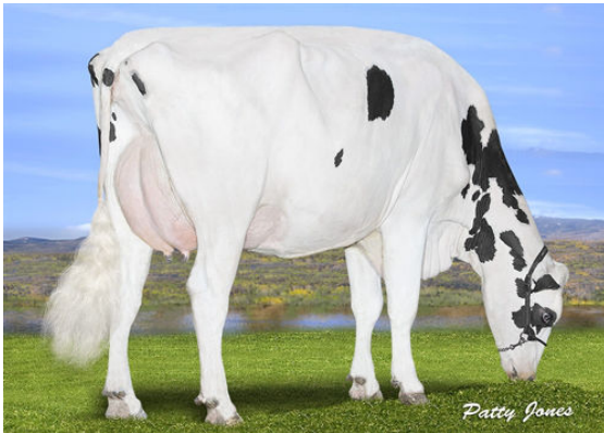
PROGENESIS DETOUR KANSAS DAM