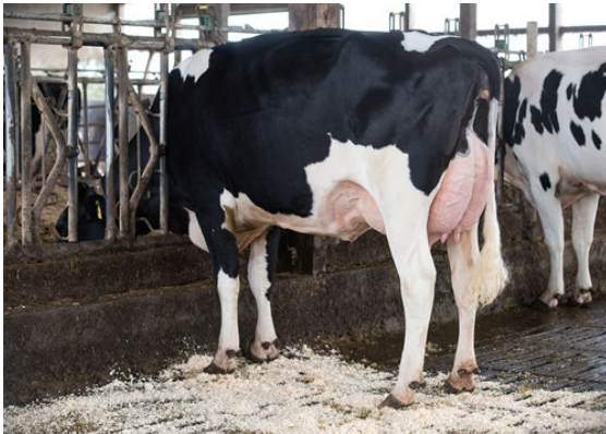
HAH ALICE DAUGHTER