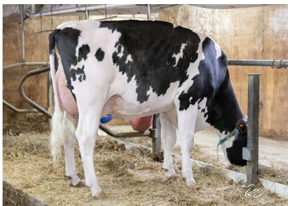
MICHERET ARDY BRIDGESTONE DAUGHTER