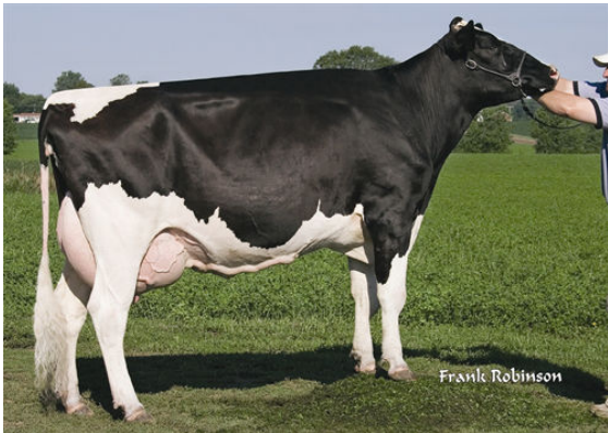
RI-VAL-RE OMAN NIKE FIFTH DAM