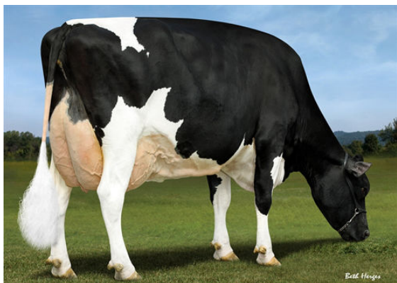
MISTY-MOOR DELTA PAILOU