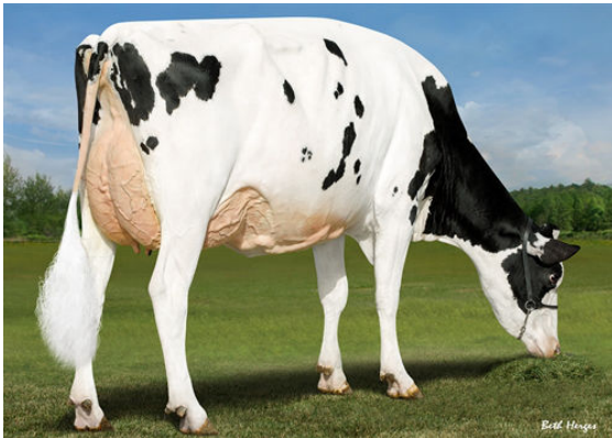
PINE-TREE 7593 TIMB 8543 DAUGHTER