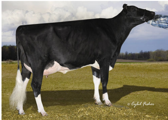
PENYA FIFTH DAM