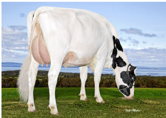
IHG MARDI SENS 9017