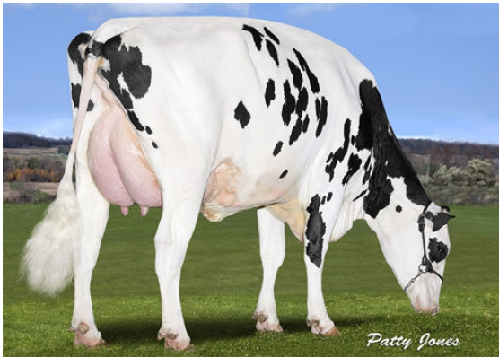
STANTONS CRAZY 4 CAMARO