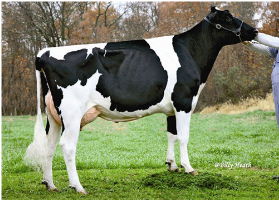
HARVUE SHOTTLE ESTHER THIRD DAM