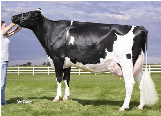
EARLY-AUTUMN GOLDEN RAE FOURTH DAM