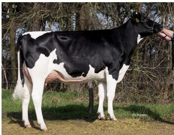
RETRAITEHOEVE LILYA 5