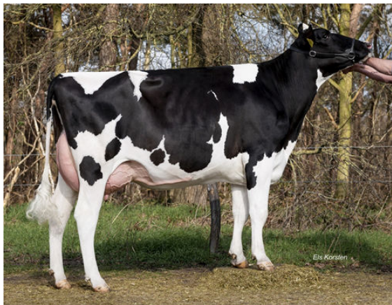
RETRAITEHOEVE MINA 240