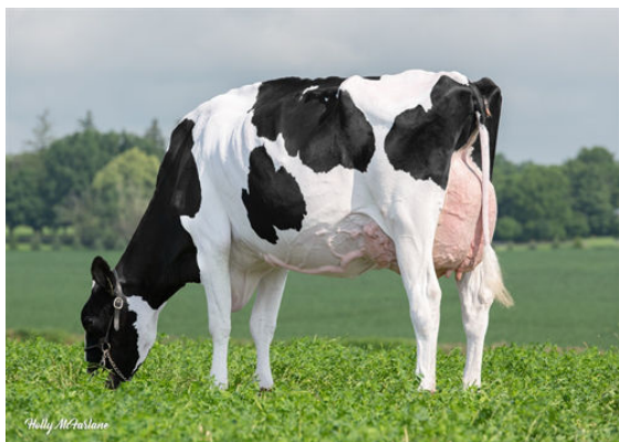
CLAYNOOK FINOLA EUGENIO DAUGHTER