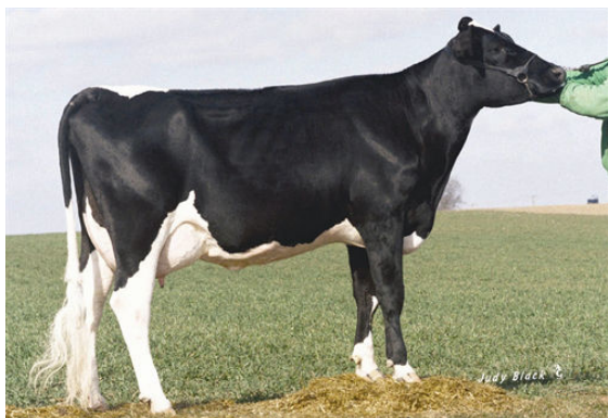
DA-NET PATRON PANSY FIFTH DAM