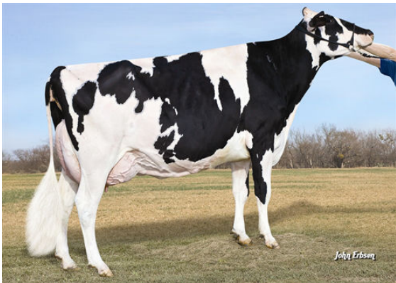
MORNINGVIEW BAXTER D-RAE GRANDDAM