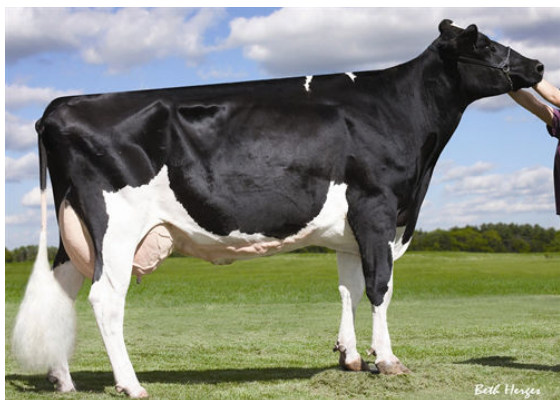
MS SULLY OMAN MUETZE FOURTH DAM