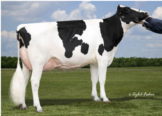
MS APPLES UNO ADELE DAM