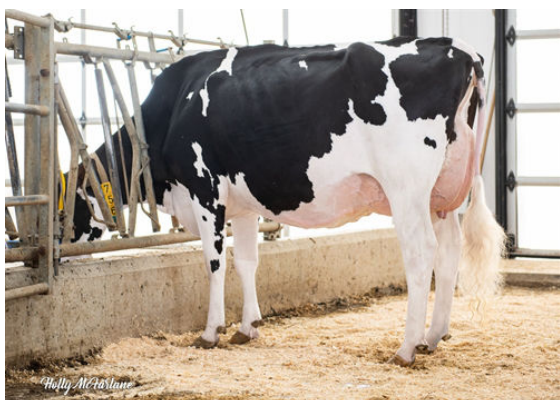
EARLEN DEALMAKER MISTY DAUGHTER

CROTEAU LESPERRON UNIX CLAYNOOK DAWNETTE HUNTER EX-90-4YR-CAN 7* COOKIECUTTER MOM HUNTER OCD PLANET DIAMOND EX-92-3E-CAN 29* ENSENADA TABOO PLANET MISS ELEGANT DELIGHT VG-88-2YR-USA DOM 3*