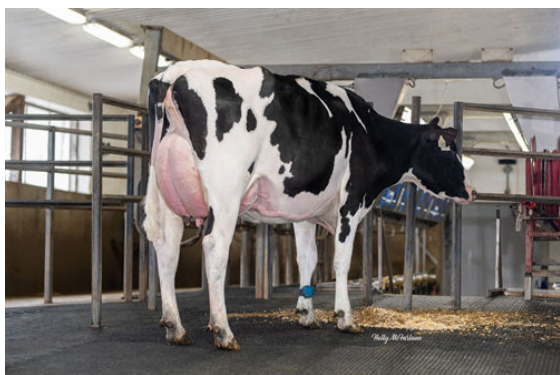
ATHLONE BARDO MOLASSES