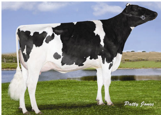
SEAGULL-BAY SSIRE DEBRA