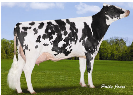
STANTONS SHAMROCK ENERGY