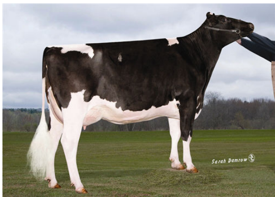
SULLY HART DOMAIN 133