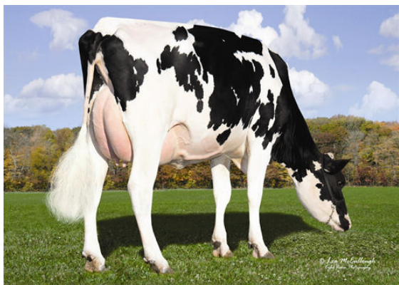
OCD MAN-O-MAN FANTOM