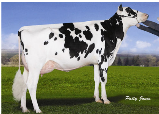
GILLETTE BOLTON 2ND LOOK