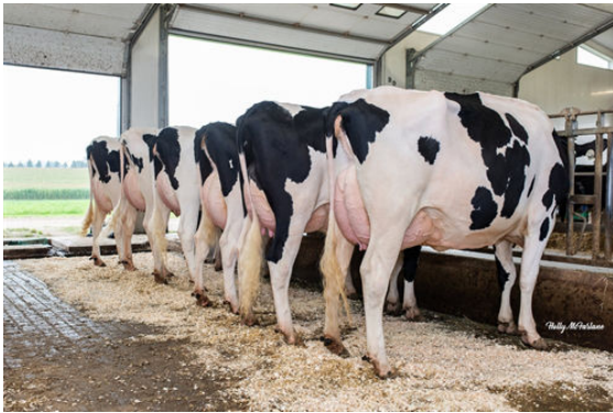
CINDERDOOR DAUGHTER GROUP

R-L Glen Islay Cinderdoor Starling, Frost, Rummy, Bomba, Fieldholme Cinderdoor Coochie, Glen Islay Cinderdoor Brynn