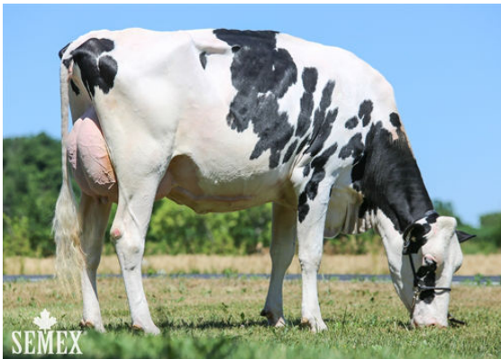
MARANIE GENEVA CINDERDOOR

R-L Glen Islay Cinderdoor Starling, Frost, Rummy, Bomba, Fieldholme Cinderdoor Coochie, Glen Islay Cinderdoor Brynn