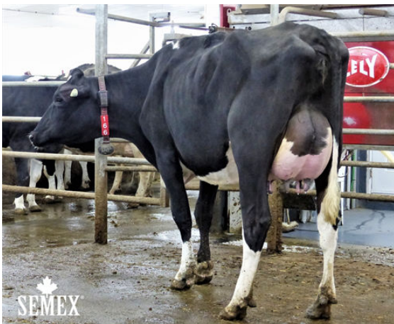
ANTELIMARCK HALEP CINDERDOOR