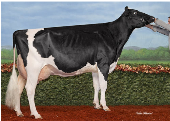
RMW FACEBOOK ASHLEY FIFTH DAM