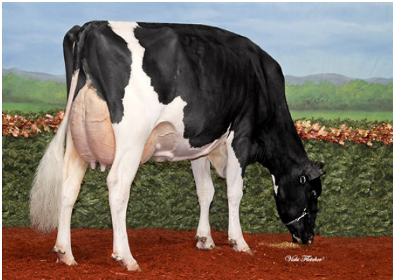
RMW FACEBOOK ASHLEY FIFTH DAM