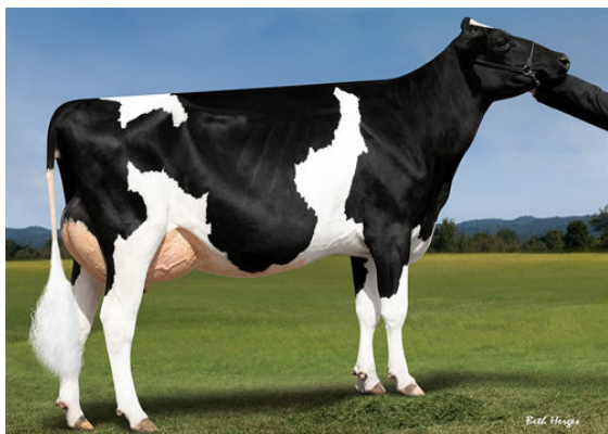
OCD JEDI TAYA 37904